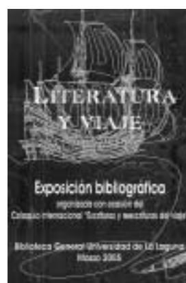
CARTEL DE LA EXPOSICIÓN.

FRANCISCO JAVIER CASTILLO El Comité Organizador del Coloquio Internacional "Escrituras y reescrituras del viaje", celebrado en la Facultad de Filología del 2 al 5 de marzo, tomó la iniciativa de complementar las sesiones de trabajo del coloquio con una exposición bibliográfica que ilustrara todo el universo de los viajes y la representación textual de los mismos. Así nació Literatura y viaje , una muestra que puede visitarse en el vestíbulo de la Biblioteca General hasta mediados del mes de abril. La exposición se ha montado mayoritariamente sobre una parte representativa de los fondos que a este respecto posee la Universidad de La