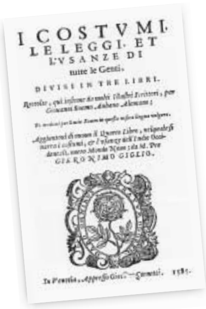
PORTADA DE UNO DE LOS LIBROS EXPUESTOS EN LA MUESTRA.

Las obras expuestas se acompañan de ocho paneles con ilustraciones pertenecientes a las piezas de la muestra y que quieren ser un pequeño homenaje a la magnífica labor desarrollada por los grabadores, dibujantes e ilustradores.