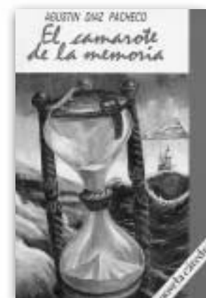
AGUSTÍN DÍAZ PACHECO, EL CAMAROTE DE LA MEMORIA, EDICIONES CÁTEDRA, SA, 1987.

Las obras expuestas se acompañan de ocho paneles con ilustraciones pertenecientes a las piezas de la muestra y que quieren ser un pequeño homenaje a la magnífica labor desarrollada por los grabadores, dibujantes e ilustradores.