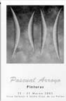
PORTADA DEL CATÁLOGO DE LA EXPOSICIÓN DE PASCUAL ARROYO.

pero por encima de todo he visto el trazo y el color de alguien plantado en medio de la vida que mira al cielo. Y he sentido una profundísima emoción y una inmensa alegría. Para esas sensaciones no hay retrasos.