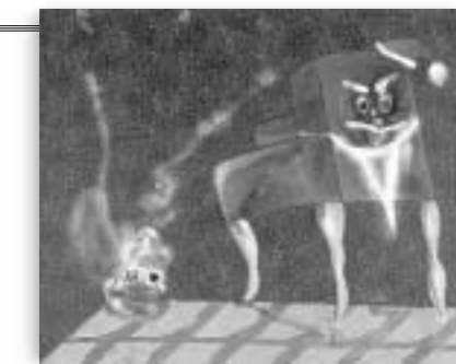
SIN TÍTULO. TÉCNICA MIXTA SOBRE TELA, 2004.