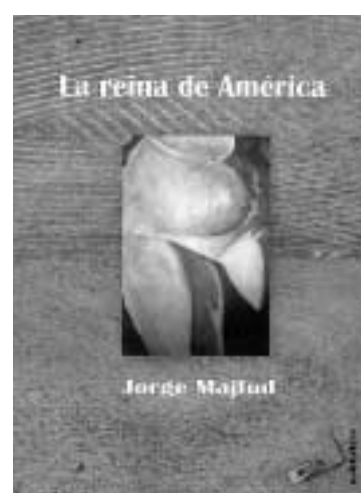
JORGE MAJFUD. LA REINA DE AMÉRICA. BAILE DEL SOL.