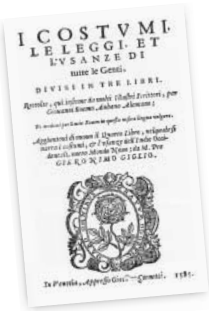
PORTADA DE UNO DE LOS LIBROS EXPUESTOS EN LA MUESTRA.

países desde la creación del mundo. Esta obra, publicada por primera vez en Venecia en 1483, se debe a Jacopo Filippo de Bérghamo, de la orden de los eremitas de San Agustín, que compartió la vida religiosa con la investigación histórica. El ejemplar que se expone corresponde a la edición veneciana de 1490 y constituye, desde el punto de vista bibliográfico, la pieza más notable de la muestra. Cabe destacar, también, la Historia de gentibus septentrionalibus de Oleas Magnus, escrita a mediados del siglo XVI, y que constituye un detallado relato de los países nórdicos, con amplia información sobre historia natural, sobre las costumbres en el ocio y en el negocio, en la paz y en la guerra, sobre inventos y artilugios sorprendentes, extraños fenómenos naturales, remedios terapéuticos, gigantes y monstruos, viejas supersticiones y misteriosos ritos, presagios y maleficios. Además del caudal de información que contiene, también hay que destacar el hecho de que constituye una obra notablemente bien ilustrada, con un total de 476 grabados. De igual modo, entre las piezas más antiguas de esta sección, hay que señalar la edición de I costumi, le leggi, et l'usanze di tutte le Genti de Johann Boehme, que contiene los tres libros originales de este autor, dedicados respectivamente a África, Asia y Europa, más un cuarto libro que incluye "I costumi & l'usanze dell'Indie, ouver Mondo Nuovo" de Jerónimo Giglio.